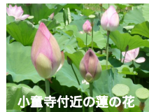
小童寺付近の蓮の花