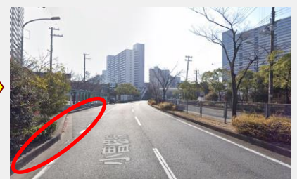
武庫川団地中央バス停付近(南向)