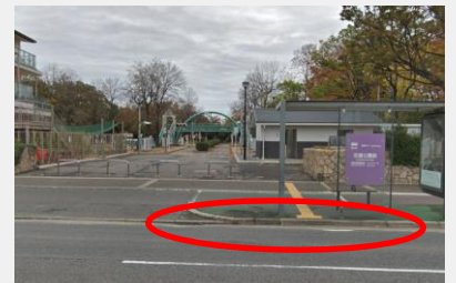
阪神バス バス停前