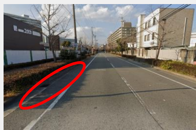
阪神武庫川団地前駅付近