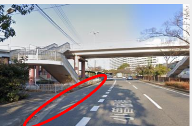
武庫川団地中央バス停付近(北向)