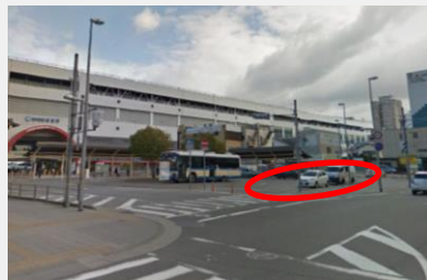
(南側ロータリー)一般車用停車区域