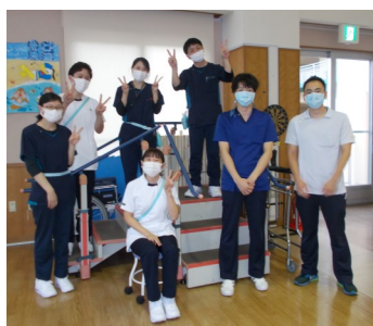
病院・訪問・通所リハビリのスタッフが揃っています!!