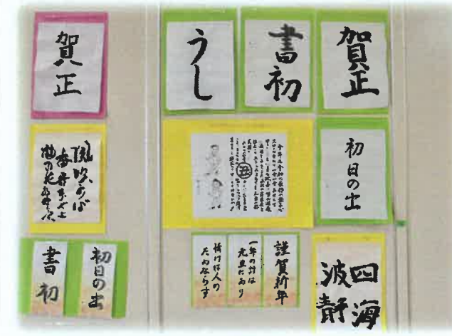
【書初めも力強く書かれていました】