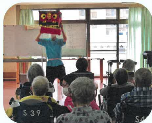
【開催しないという選択肢もありますが、出来る限りは対策して開催したいと思います】