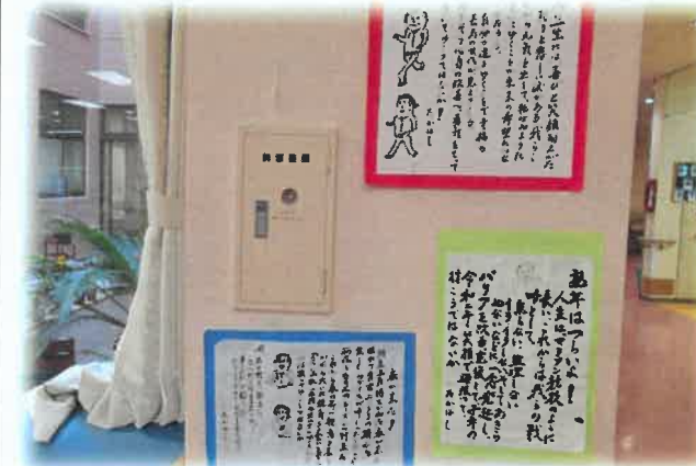
【日々の思いなども綴られます】