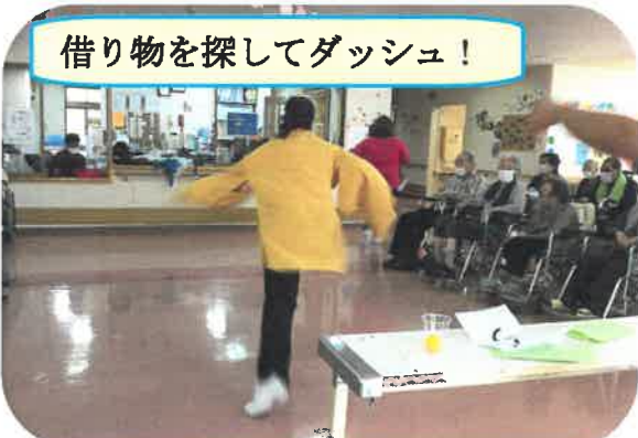
借り物を探してダッシュ！