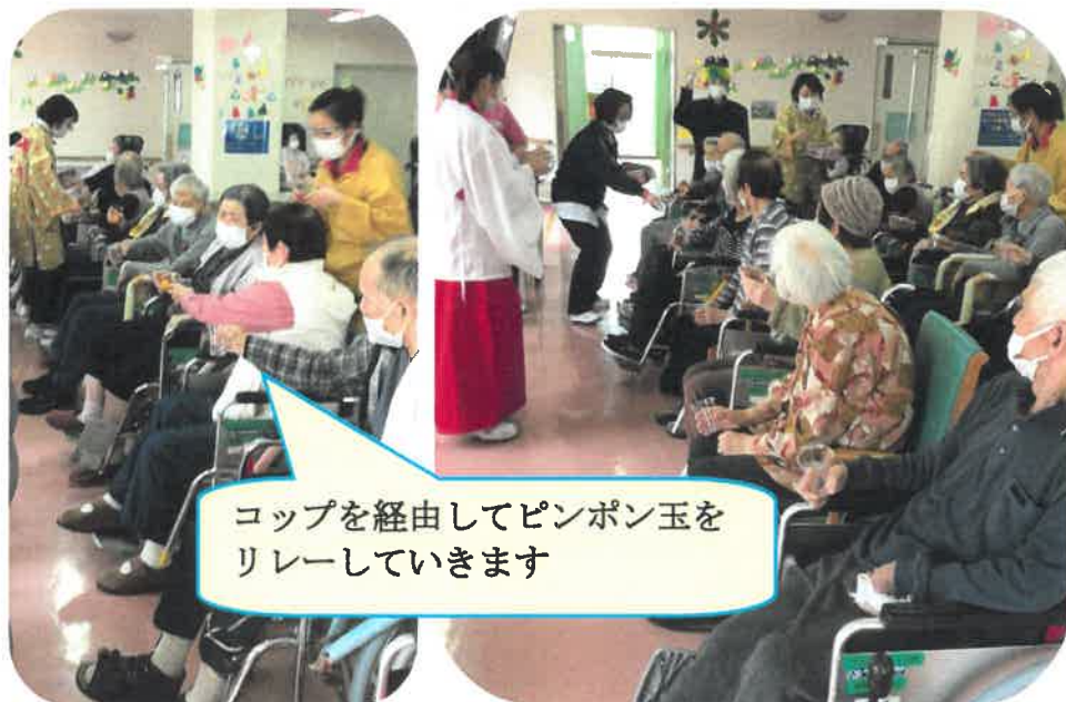
コップを經由してピンポン玉をリレーしていきます

4階では諸事情により、急遽中止となりました。楽しみにしていた利用者様には申し訳ありません。来年には大きな運動会が開催できることを祈っています。