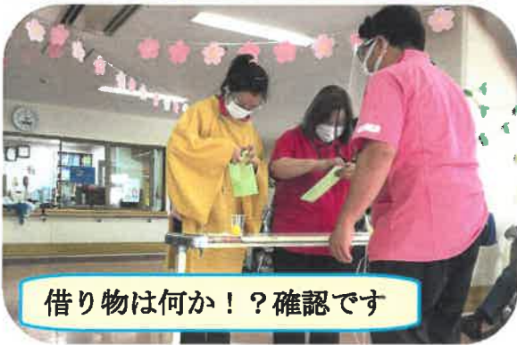
借り物何か！？確認です