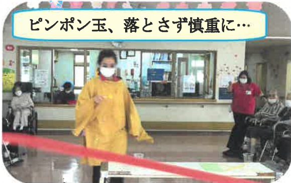
ピンポン玉、落とさず慎重に…

3階では、始めに体をほぐす為、ラジオ体操を行いました。3階の出し物は、利用者様はピンポン玉渡しゲーム、職員は仮装しての借り物競争です。借り物競争はフロア内の決められた物品を探してきます。ですが、見つけるのに手間取り逆転される場面もあつたりと、特に盛り上がっていました。