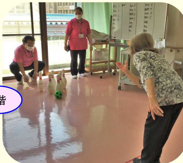
〔皆様、ご自分のできる範囲で、全力で取り組んでくださいました！〕