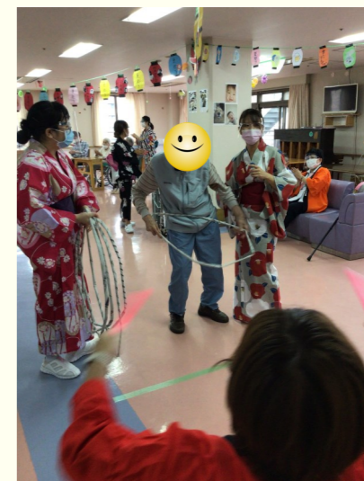
〔輪投げに盛り上がってます〕