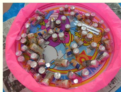
〔飲み物冷えてます〕