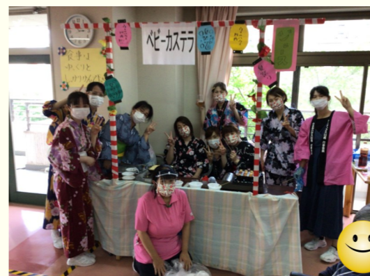
〔屋台も設営してお祭り気分〕