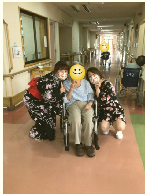
〔浴衣のスタッフとの一枚〕

皆様、踊るのを誘いしても、最初は遠慮されていましたが、時間がたつと手が足が自然とリズムに乗っているご利用者様もおられ職員と炭坑節・東京音頭・川西音頭・ビューティフルサンデーと一緒に踊りました。来年はコロナも落ち着き皆様の笑顔がもつと届けれると願っています。