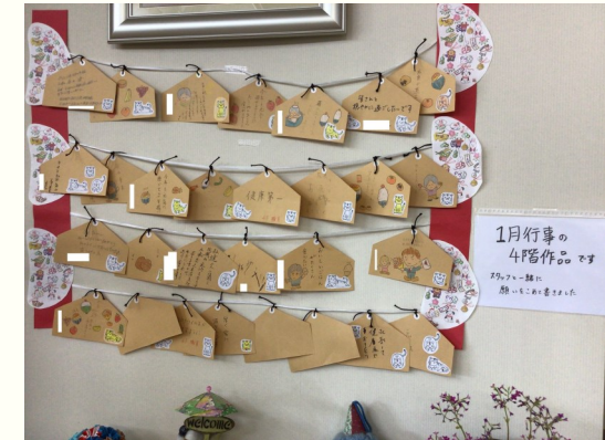
〔4階ご利用者、スタッフによる絵馬〕