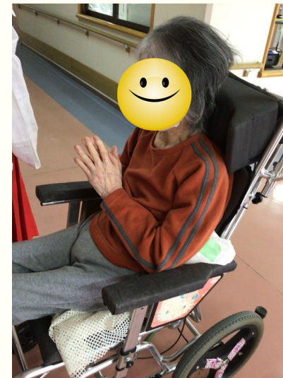
皆さんしっかり手を合わせていました