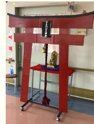
ウェルハウス川西神社

2階は獅子舞を行い、獅子舞を楽しんでもらっている間におみくじを引いて貰いました。利用者様は、おみくじで良い結果が出て喜ばれていました。その後、職員と利用者でうめぼし体操を行いました。皆さん体を動かして楽しく体操されており、アンコールも行おうことになり、皆様に喜んで頂けました。 3階は獅子舞とおみくじ後に、合唱を行いました。職員が盛り上げる為に学生服を着ておみくじを配り、利用者から「少しだけ正月気分になれて楽しかった」と言うお声を頂きました。 4階は初詣を行いました。普段はあまり参加をしてくれない利用者にも参加して頂き、初詣気分を満喫してされていました。