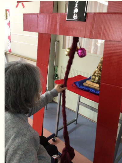
鐘を鳴らして参拝気分