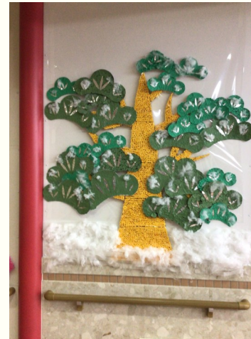
〔立派な松が表現されています〕