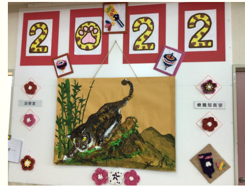
〔立派な虎と、かわいらしいトラ〕

最寄駅 阪急「川西能勢口」 から徒歩約10分 JR「川西池田」 から徒歩約15分