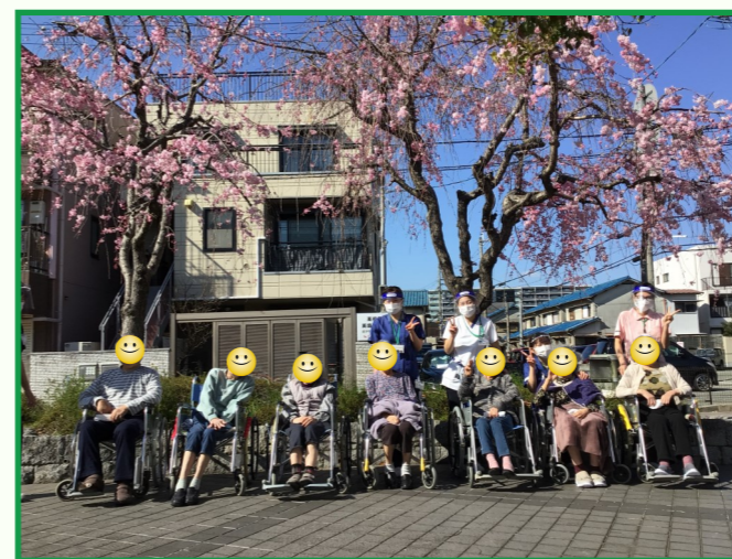
種類の違う桜も見ごろでした