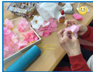
〔1つ1つ丁寧に作成しています〕