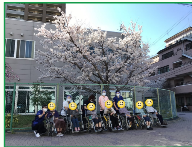
満開の桜の下で、はい、チーズ