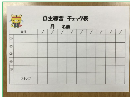
自主トレチェック表

通所リハビリでは個別での運動療法以外に、利用者様ご自身でリハビリが取り組めるよう様々なリハビリグッズを用意しています。 手作業のコーナーでは種類が充実し、ボタンや洗濯はさみを使った手や指先のリハビリ、パズルや積み木を使った頭のリハビリなどができます。 運動のコーナーでは腕や脚、体幹など部位別の自主トレカードを新たに作成しました。バイキング形式で好きな運動を選び、チェック表を使いながら自主トレに取り組めるようになったのでぜひ使用してみてください。 どんな運動をすればいいかわからない方は、目標にあわせた運動を選んでアドバイスしますのでリハビリスタンプにいつでも相談してください。 またリハビリエリアも広くなり使い易くなったので、ぜひ自主トレをやってみましょう。