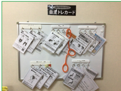
様々な自主トレカード