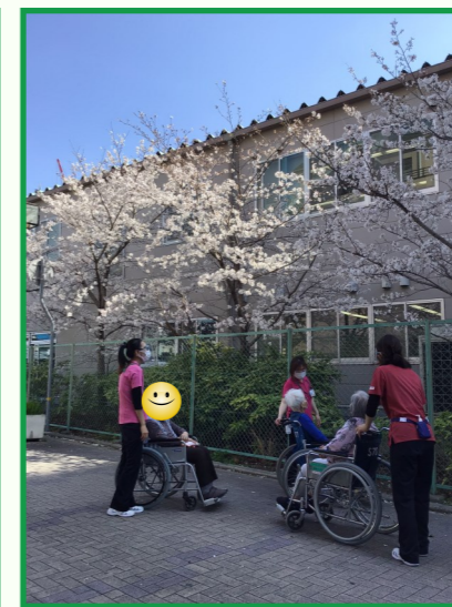
みんなでワイワイ眺めました