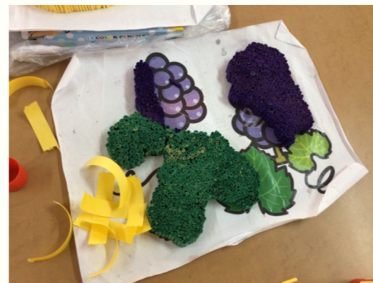
野菜と果物が美味しそうですね