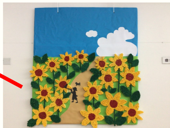
ひまわりと少年と犬 少年が虫取りを楽しんでいます