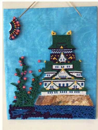
立派な大阪城です