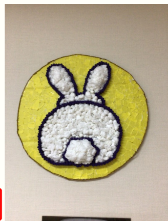
月とウサギ。お尻がかわいいですね