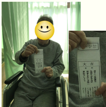
おみくじの結果は…？