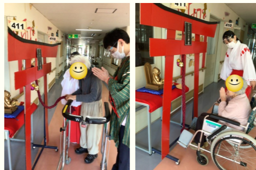
職員とお参りをし、 絵馬に願いを