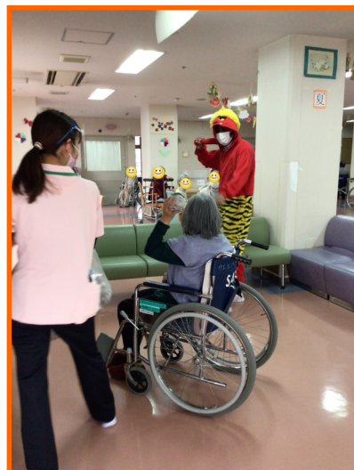
みんなでオニ退治

2月1日(水) に各フロアにて節分を行いました。 3階は職員が衣装を着て各部屋を回る予定でしたが、コロナの影響もあり大人数では実施出来ない為、数人だけですが鬼の衣装を着てもらい記念撮影をしました。衣装を着てもらった利用者さんからは笑顔でとても喜んでもらえました。 他の階も同日に行事を行い、そちらは職員が衣装を着て食事の席ごとにオニとスタッフが訪問し、思いがけず盛り上がりしました。 今年度はコロナ対策等で行事を満足に行えなかった為、来年度は大人数で集まれずとも各部屋を回って節分を行いたい