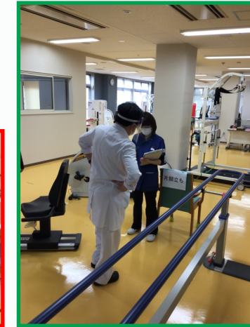
身体の様子を数値化します