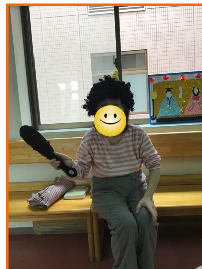
オニに扮して記念撮影