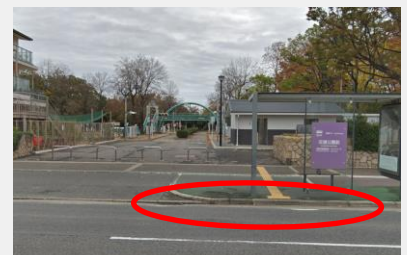
阪神バス バス停前