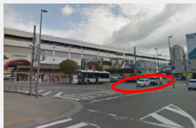
(南側ロータリー)一般車用停車区域