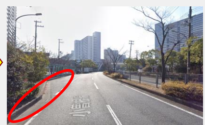
武庫川団地中央バス停付近(南向)