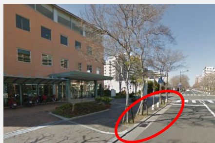
マリナホスピタル 北側玄関前