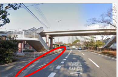
武庫川団地中央バス停付近(北向)