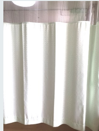
居室内 仕切りカーテン