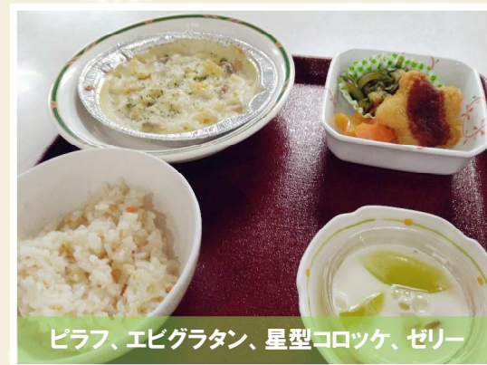
ピラフ、エビグラタン、星型コロッケ、ゼリー