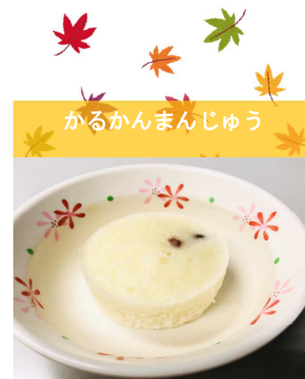
かるかんまんじゅう