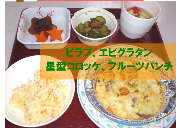
ピラフ、エビグラタン 星型コロケ、フルーツパンチ