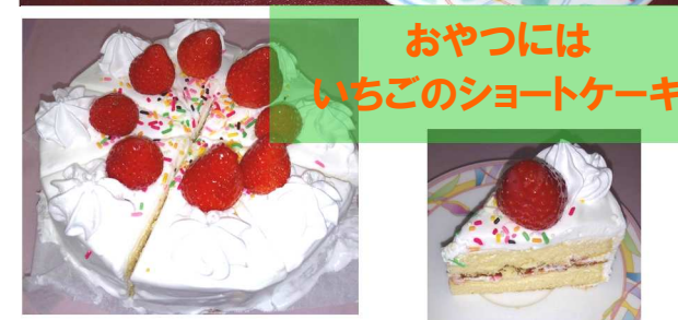
おやつには いちごのショートケーキ

誕生日会 赤飯 海老と鱈のフライ カリフラワーケチャップ炒め アスパラのピーナツ和え コンソメスープ