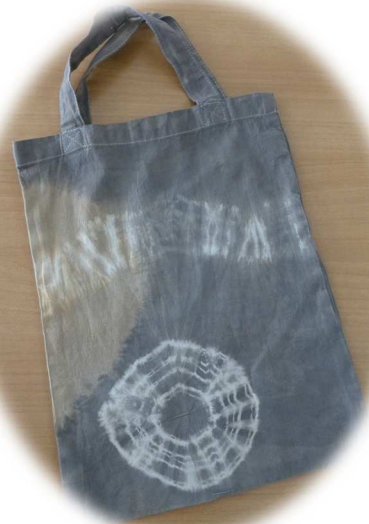
エコバッグを栗のイガで染めました